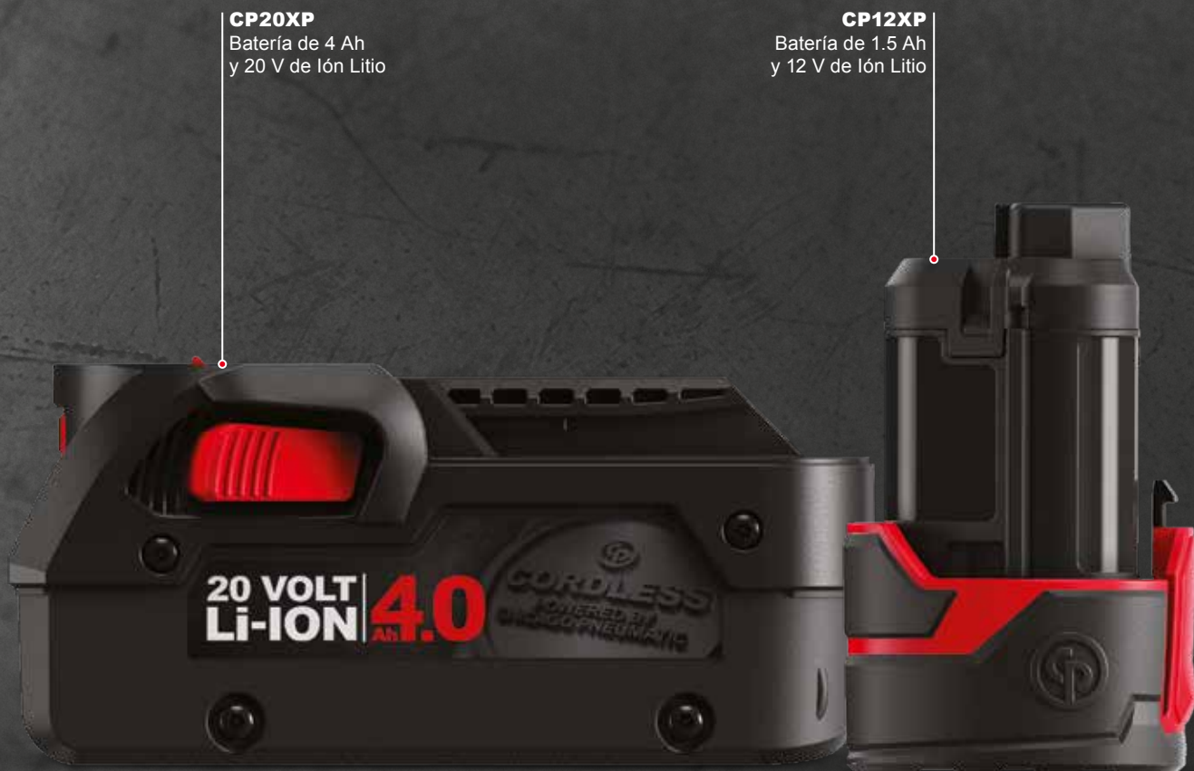
CP20XP Batería de 4 Ah y 20 V de Ión Litio