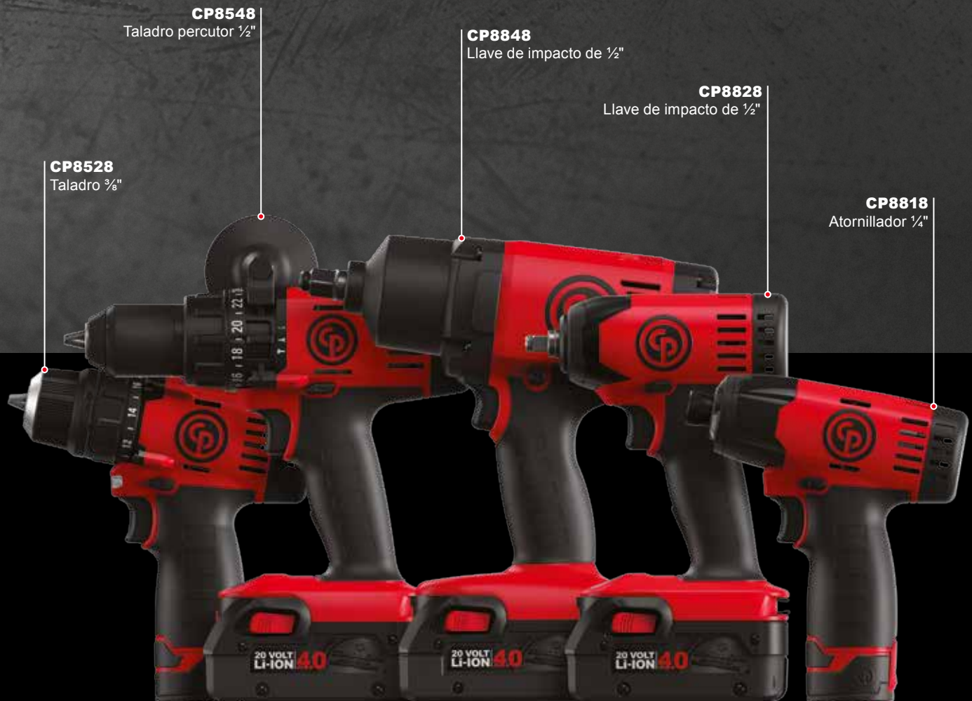
CP8528 Taladro 3/8"