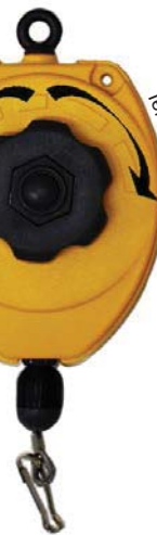
MI-TW2R 1,00 - 2,00 Kg