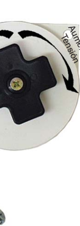
MI-RW5 2,50 - 5,00 Kg