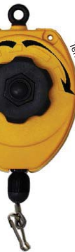
MI-TW2R 1,00 - 2,00 Kg