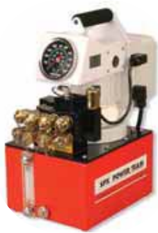
PE55TWP Aplicaciones de llave dinamométrica Consulte la página 162.