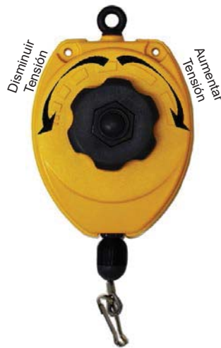
MI-TW1R 0,50 - 1,50 Kg