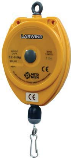
MI-TW06R 0,20 - 0,60 Kg