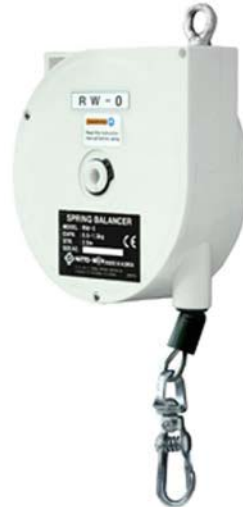
MI-RW0 0,50 - 1,50 Kg