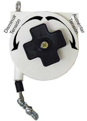
MI-RW3 1,00 - 3,00 Kg