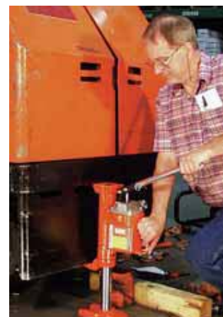
El gato de uña de la serie J es un gato extremadamente robusto utilizado para reparar carretillas elevadoras.