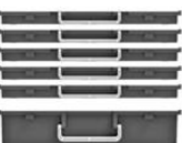
5 x H30 + 1 x H95 mm