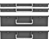
2 x H30 + 2 x H95 mm