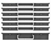
6 x H30 + 1 x H60 mm