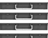
4 x H60 mm