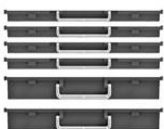
4 x H30 + 2 x H60 mm