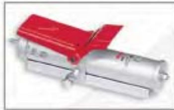
NS-1 Bomba oleoneumática. Opcional