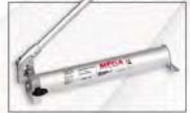
BMP-1 Bomba a pedal. Opcional

Para reparar con precisión las carrocerías más fuertemente dañadas. La posibilidad de giro del brazo de nuestra escuadra incrementa su versatilidad al permitir realizar trabajos de tiro en diagonal.