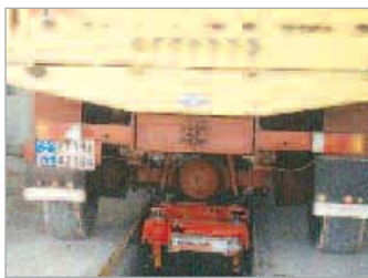
Bomba manual P300 y cilindros de 10 toneladas usadas para levantar un vehículo.