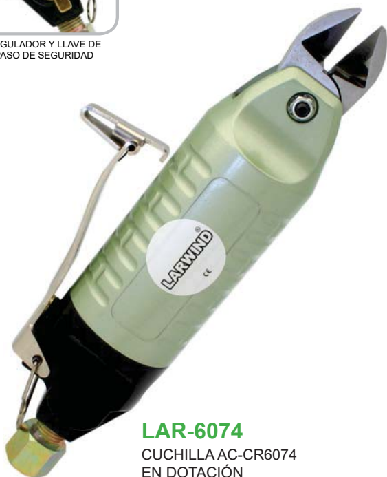
LAR-6074 CUCHILLA AC-CR6074 EN DOTACIÓN