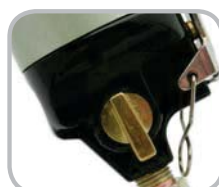
REGULADOR Y LLAVE DE PASO DE SEGURIDAD