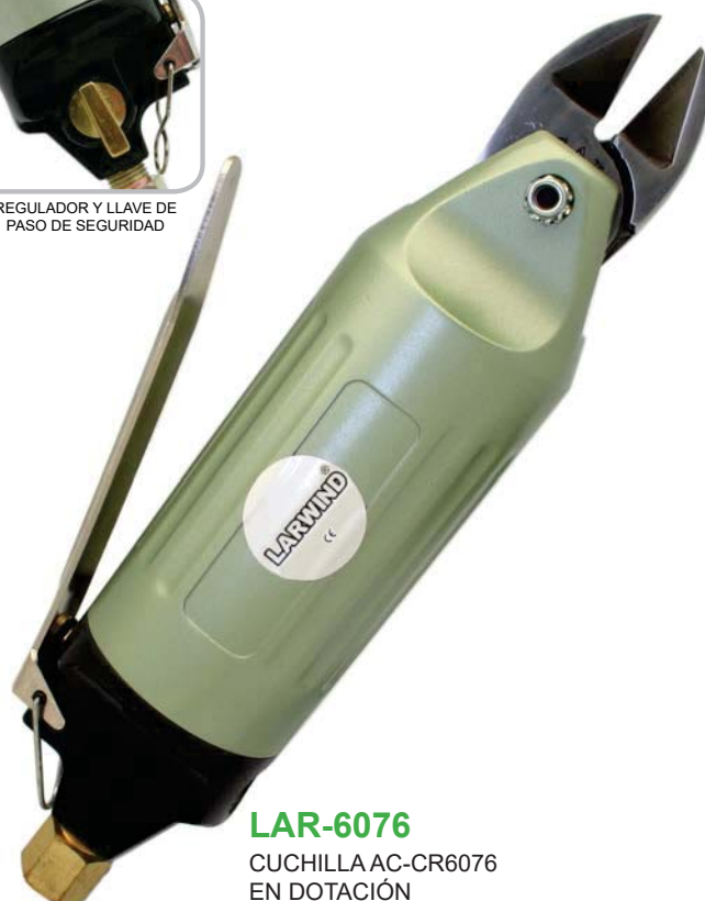
LAR-6076 CUCHILLA AC-CR6076 EN DOTACIÓN