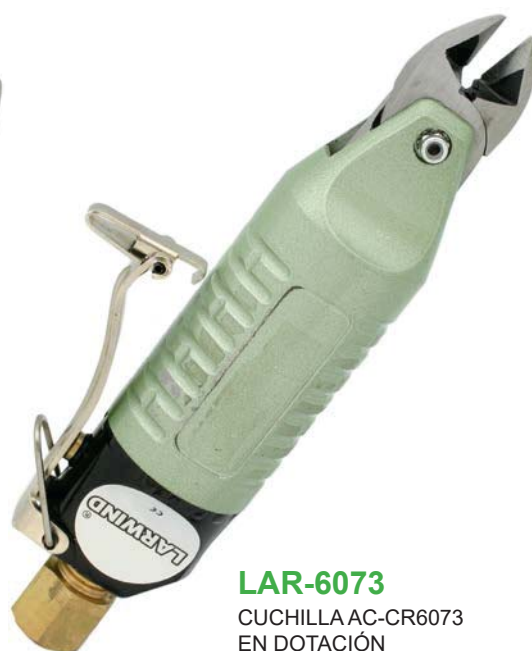
LAR-6073 CUCHILLA AC-CR6073 EN DOTACIÓN