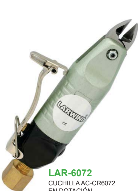
LAR-6072 CUCHILLA AC-CR6072 EN DOTACIÓN