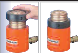
El collar inmovilizador permite el soporte no hidráulico de la carga.