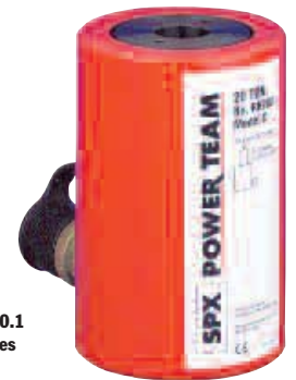
ASME B30.1 700 bares

10, 20, 100 toneladas Los modelos de acción simple incluyen un collar liso