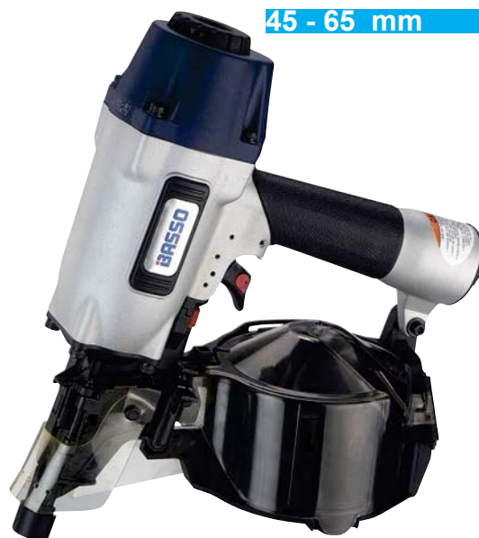
CLAVO EN BOBINA