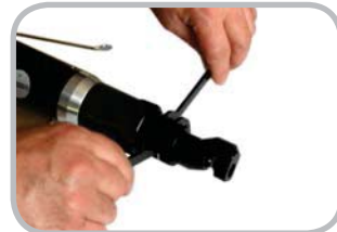
SENCILLO CAMBIO DE CABEZAL

La capacidad máxima de corte indicada puede variar función del material y su dureza