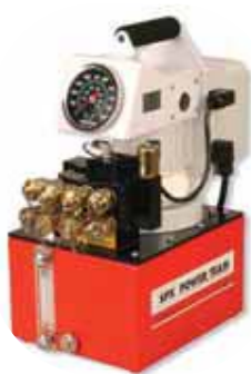
PE55TWP Aplicaciones de llave dinamométrica Consulte la página 162.