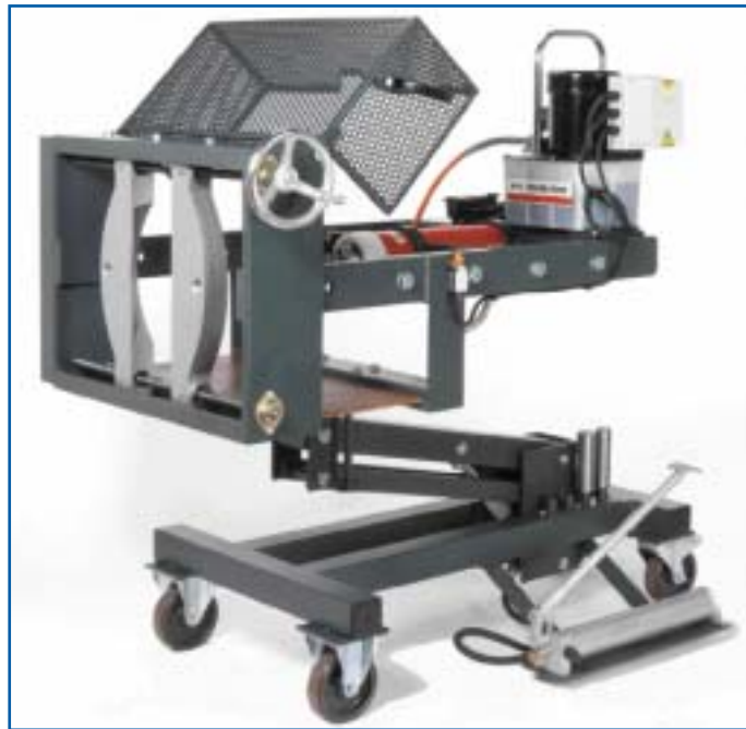
Mobipuller 25 o 50 toneladas. ▲ Enforcer, 100 toneladas (2-brazos). ▲ Enforcer 55 toneladas (3-brazos). ▲