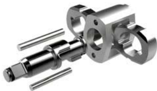
SISTEMA IMPACTO DOBLE MAZA

Llaves de impacto con certificación ATEX para trabajos de apriete de M10 a M45. Diseñadas para funcionar en ambientes potencialmente explosivos tales como minería subterránea y a cielo abierto, refinerías de petróleo, gasoductos, oleoductos e industria química y de generación de energía ***