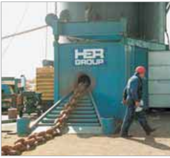
Bomba PE4004S y cilindro RD3006 usados en una prensa especial que repara eslabones de cadena dañados para la industria naval.