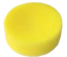
Con Htas. 203P