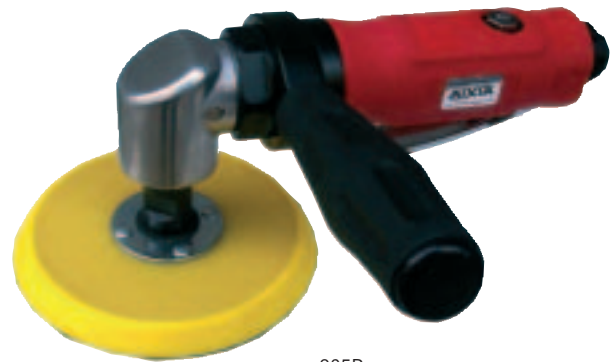
205P Puede usar discos de 75 y 125 mm