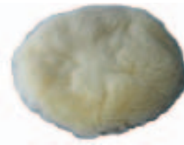
Con Htas. 205P, 241