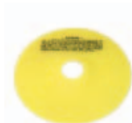
Para Htas: 222SD