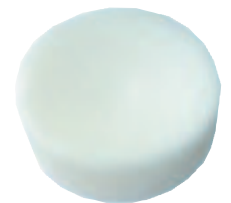
Con Htas. 203P