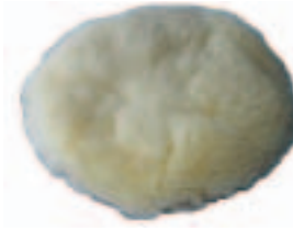
Con Htas. 203P, 205P