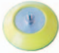
Con Htas. 203P, 903V