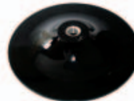
Con Htas. 230, 231, 241