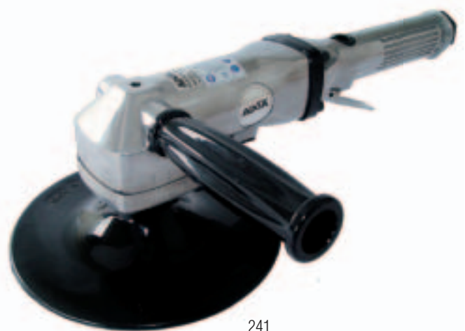
241 Puede usar discos de 125, 150 y 180 mm