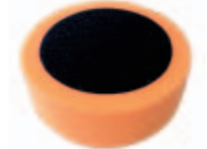
Con Htas. 241, 205P