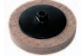
Con Htas. 241