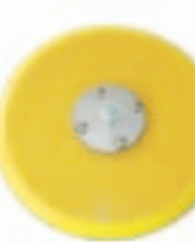
Con Htas. 764, 821, 905, 906, 907, 205P