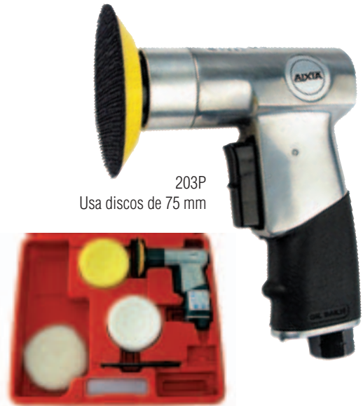
203P Usa discos de 75 mm