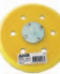
Con Htas. 822D, 906D, 907D, 905(AD-BD)