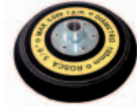
Con Htas. 230, 231, 241