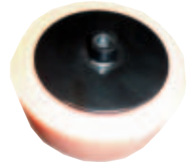
Con Htas. 241