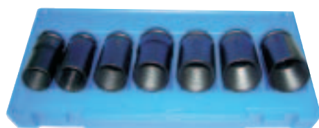
Kit extractor tuercas antirrobo