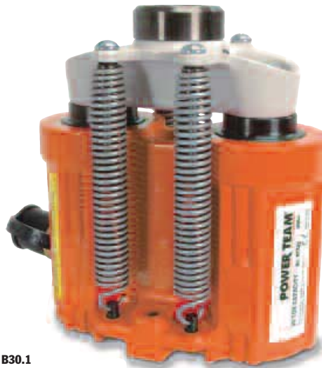
ASME B30.1 700 bares