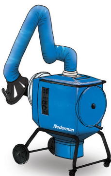
FilterBox 12 eQ Unidad ergonómica de gama alta para aplicaciones pesadas de polvo y humos