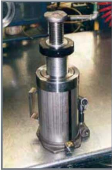
Gato de botella con tuerca de bloqueo.