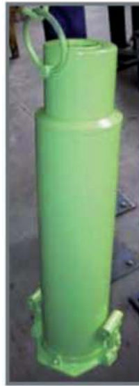
Gato de botella de 2 velocidades de larga carrera. 50 Tn de capacidad.