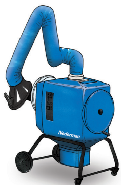
FilterBox 12 A Con limpieza de filtro automática para aplicaciones pesadas de polvo y humos

El FilterBox es adecuado también para soldadura en acero inoxidable (> 30% de contenido de cromo) y cumple los requisitos OSHA para el cromo (VI).