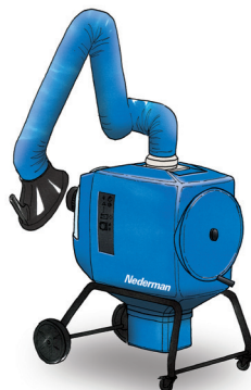
FilterBox 10 A Con limpieza automática del filtro para aplicaciones de extracción de polvo y humo ligeras o medias