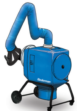
FilterBox 12 M Eficiente unidad con limpieza manual del filtro y ventilador de alto rendimiento para aplicaciones pesadas