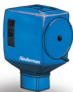
FilterBox de Pared Una unidad versátil sin brazo de extracción para conectar a un ventilador externo