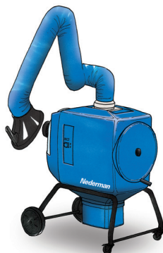
FilterBox 10 M Una unidad muy eficiente en coste con limpieza manual del filtro para aplicaciones ligeras o medias