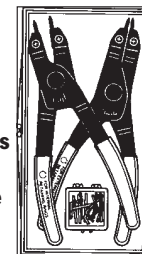
7053K Pinzas internas y externas, 4 tamaños de puntas.

Nº 209201 – Puntas de repuesto (par) para las pinzas 7300 y 7301. Peso 0,1 kg.