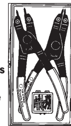
7053K Pinzas internas y externas, 4 tamaños de puntas.

Nº 209201 – Puntas de repuesto (par) para las pinzas 7300 y 7301. Peso 0,1 kg.