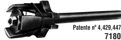
Patente n° 4,429,447 7180