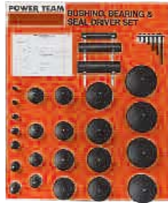
N° 27793 Conjunto de principiante (tablero no incluido)