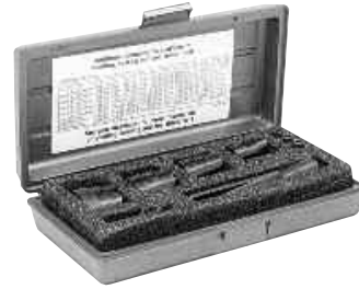
27797 Conjunto principal