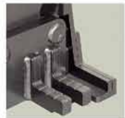
Uña de elevación extra baja (25 mm)

MGL-10 es la combinación de la estructura de elevación BL-10 y el gato MG-10 (también puede utilizarse el gato MG-8.)