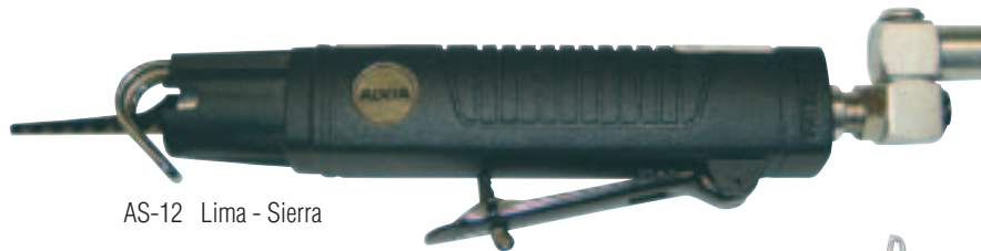
AS-12 Lima - Sierra