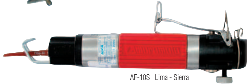
AF-10S Lima - Sierra