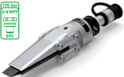
FLS15 CON ZAPATAS DENTADAS—CUÑA TOTALMENTE ABIERTA