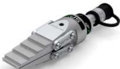
FLS15-ST CON ZAPATAS ESCALONADAS—CUÑA CERRADA