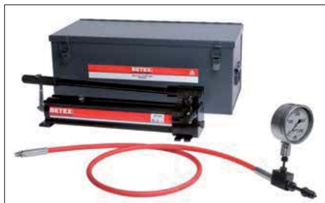
Juego de bomba de mano UHP 2800